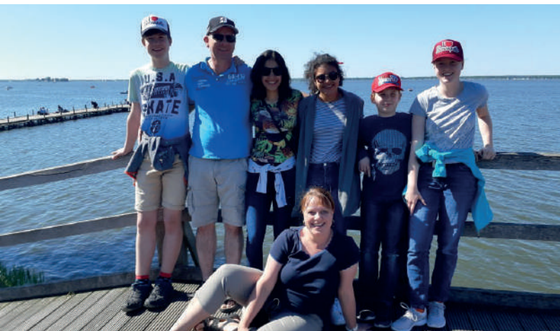
Deutsche Gastfamilien mit Ihren kolumbianischen Gastkindern

Der Austausch hat für viele unserer Schüler einen großen Einfluss auf ihre Zukunft: Sie entwickeln einen besonderen Bezug zu Deutschland, kehren motiviert in den Deutschunterricht zurück und entdecken die Möglichkeiten, was ein Studium in Deutschland für sie bedeuten könnte. Für viele ist diese erste Reise nach Deutschland nicht die Letzte!