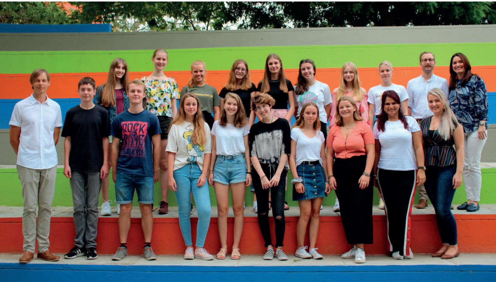
Besuch aus Deutschland

Der Gegenbesuch kann unterschiedlich lang sein. Während sich manche für ein ganzes Schuljahr entscheiden, besuchen uns andere für ein paar Wochen oder Monate. Außerdem besteht die Möglichkeit am deutschsprachigen Ferienprogramm, dem „Sommercamp“ zwischen Juni und Juli aktiv teilzunehmen, um mit Deutsch lernenden kolumbianischen Schülerinnen und Schülern Freizeitaktivitäten zu unternehmen.